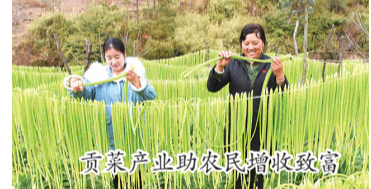
贡菜产业助农民增收致富