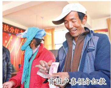
贫困户喜领分红款