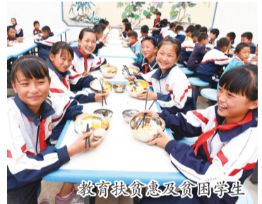
教育扶贫惠及贫困学生

深入开展万名干部“大下乡、大入户、大宣讲”行动,“自强、感恩、我是扶贫一线共产党员”主题实践活动。省州县挂包责任部门3432名挂包干部对8214户挂包农户入户宣讲2万多场次,县级宣讲小分队到乡镇集中宣讲10次,各乡村挂包干部及驻村扶贫工作队到行政村和自然村集中宣讲3700多场次。充分利用广播、电视、报纸、新闻媒体、网络等工作平台宣传报道扶贫开发工作中涌现的先进经验、典型事例、模范人物。2015年以来,巍山县扶贫开发宣传信息被上级媒体刊载报道936条,其中:国家级42条,省级媒体166条,州级728条。在巍山电视台、《巍山消息》等开设脱贫攻坚专栏,及时刊播全县14个行业部门的政策解读,并在各乡镇、村、组,利用村民活动场所和小广播、“大喇叭”进行每天播放宣传。