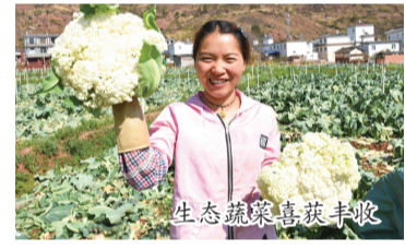
生态蔬菜喜获丰收